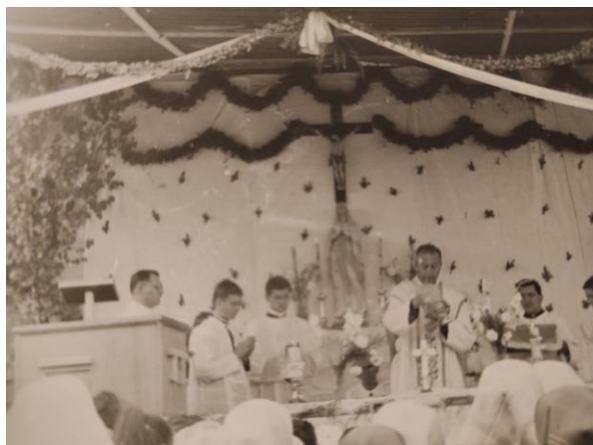
Požehnanie zákl. kameňa, 22. jún 1969