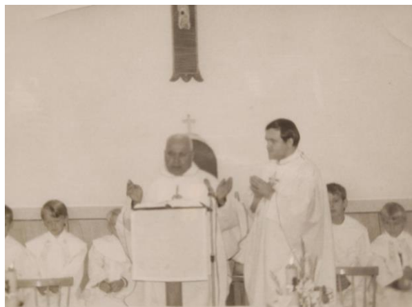
Posvätenie kostola, 28. november 1974

Pozývame Vás na slávnostnú sv. omšu z príležitosti 50. výročia posvätenia kostola, vo štvrtok, 28. novembra 2024 do kostola v Janovíku o 18:00 hod.